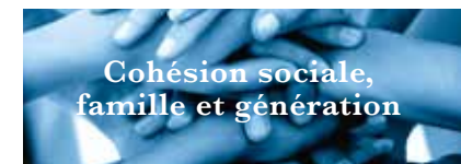
Cohésion sociale, famille et génération

En bref: ce projet de loi vise à simplifier l'organisation des commissions consultatives prévues par la loi sur la faune, en supprimant la commission consultative de régulation de la faune, dont les compétences «doublent» avec celles de la commission consultative de la diversité biologique.