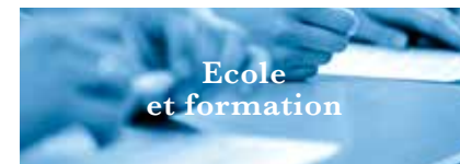
Ecole et formation

certains couples par exemple, suffire à provoquer le passage à un taux supérieur d'imposition.