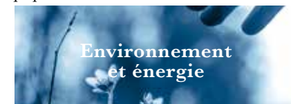
Environnement et énergie

d'améliorer la planification hospitalière par une meilleure répartition de l'offre médicale, assurant une couverture sanitaire idéale pour l'ensemble de la population de Suisse occidentale.