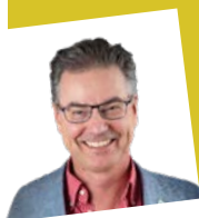
Par Florian Barro