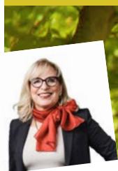
Par Michèle Roulet

impasse, Sandrine Salerno a précisé que ces panneaux sont appelés à évoluer, et que les personnes qui se sentent oubliées pourront venir le dire « pour qu'on commence à discuter ». Les réclamations vont déferler auprès de la Mairie de Genève ! A qui reviendra la compétence de déterminer les logos ? Un pictogramme avec une femme en talons aiguilles déchaînera-t-il des actes violents des « Chiennes de garde », outragées par ces « potiches » ? Enfin, jusqu'où ira ce délire qui n'entraînera que clivages et divisions ?